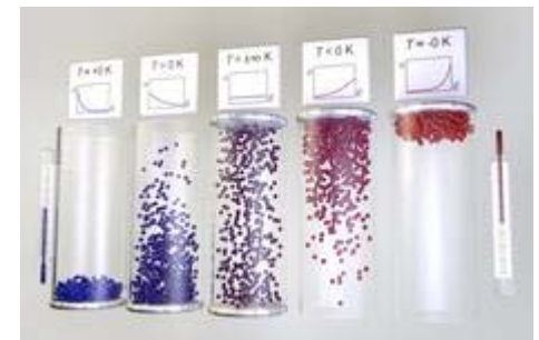
Boltzmann-Verteilungen nach der Definition der Forscher